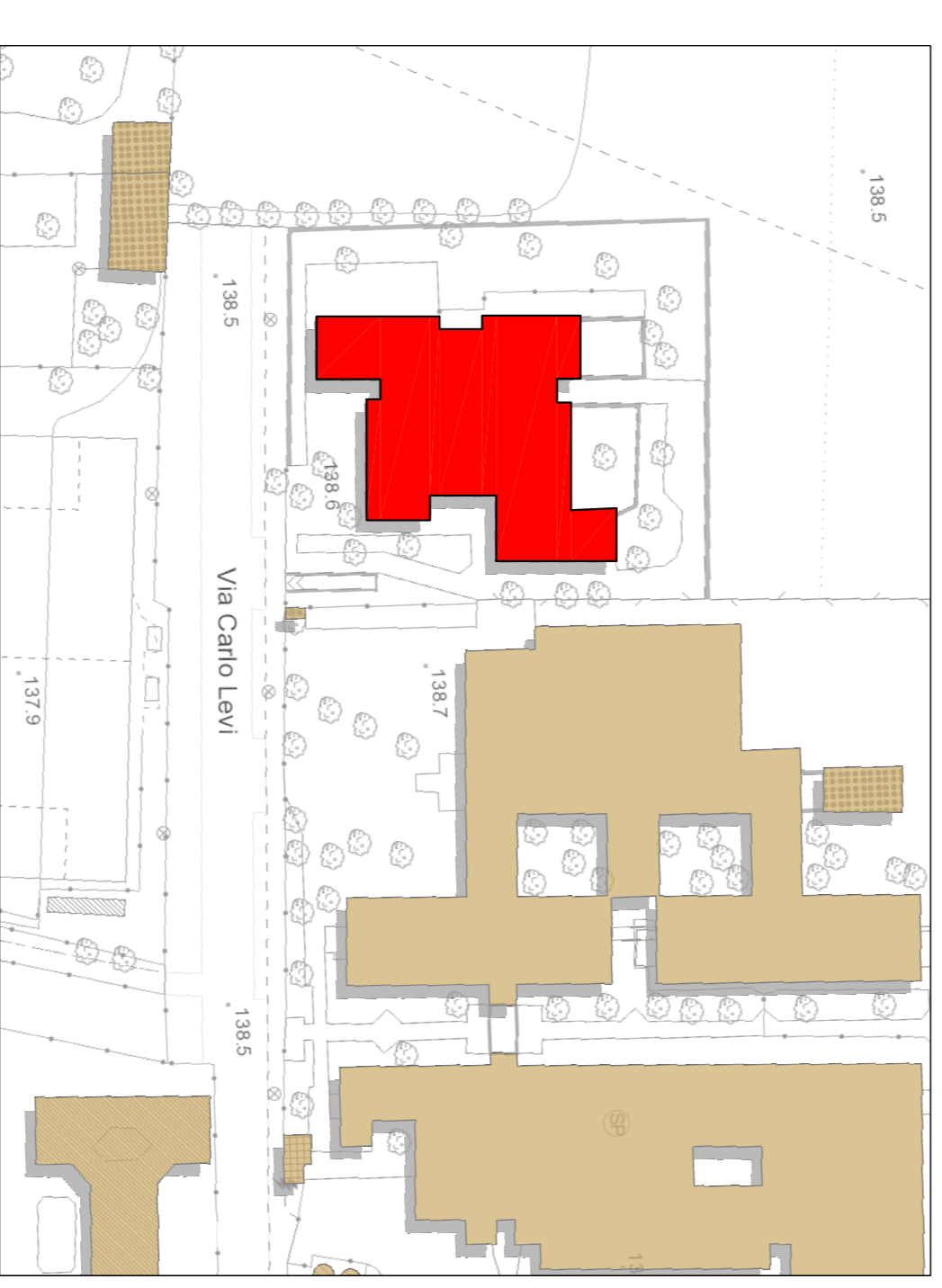
INQUADRAMENTO SCALA 1:1000