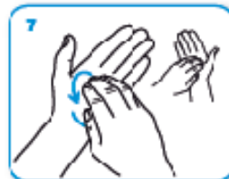
7 7 frizione rotazionale, in avanti ed indietro con le dita della mano destra strette tra loro nel palmo sinistro e viceversa