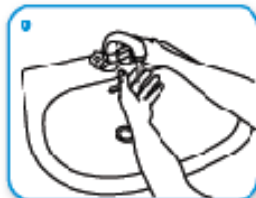
0 3 agna le mani con l'acqua

Durata dell'intera procedura: 40-60 secondi