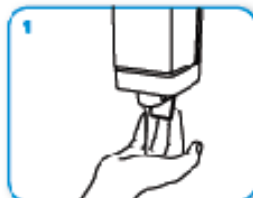
1 1 applica una quantità di sapone sufficiente per coprire tutta la superficie delle mani