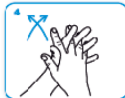
4 4 palmo contro palmo intrecciando le dita tra loro