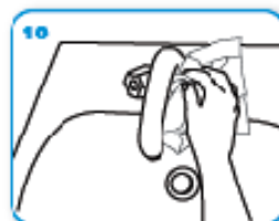
10 10 usa la salvietta per chiudere il rubinetto