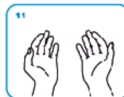
11 11 ...una volta asciutte, le tue mani sono sicure.