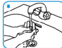
8 8 Risciacqua le mani con l'acqua