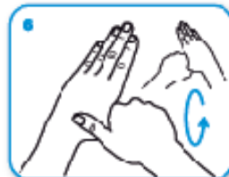
6 6 frizione rotazionale: del pollice sinistro stretto nel palmo destro e viceversa