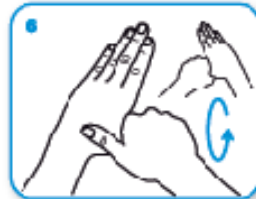
6 frizione rotazionale del pollice sinistro stretto nel palmo destro e viceversa