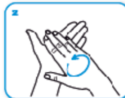
2 friziona le mani palmo contro palmo