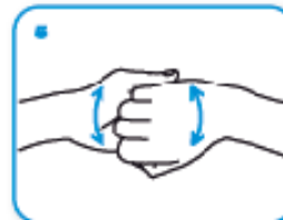
5 dorso delle dita contro il palmo cposto tenendo le dita strette tra loro